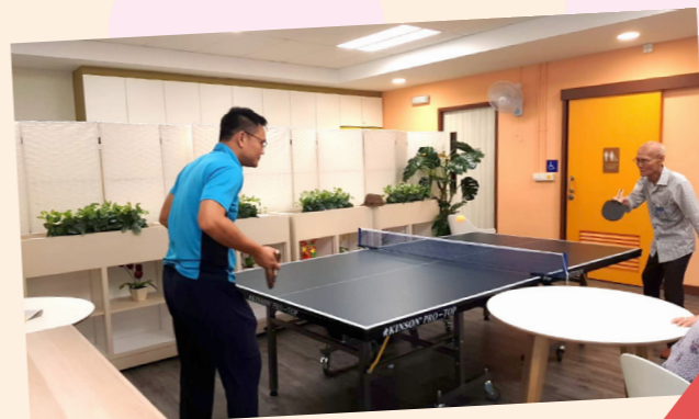
乒乓球事工 - 福音之光基督教会捐赠乒乓球桌