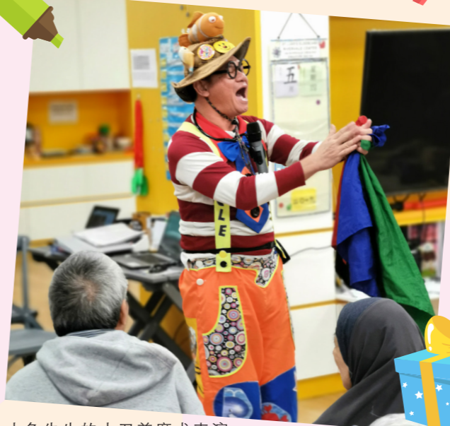
小鱼先生的小丑兼魔术表演