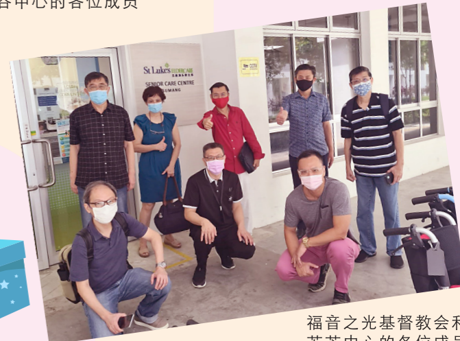
福音之光基督教会和苏芒中心的各位成员