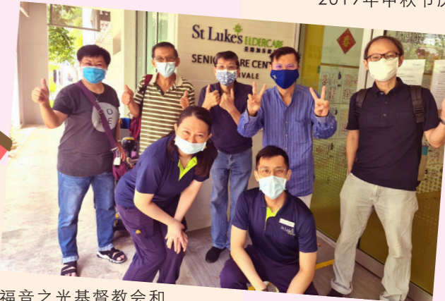
福音之光基督教会和河谷中心的各位成员