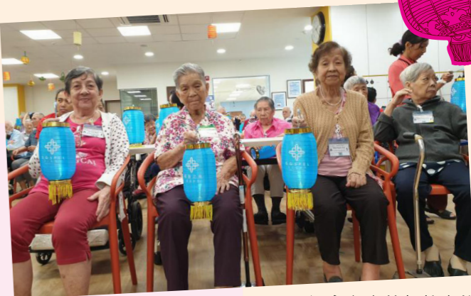
福音之光基督教会的2019年中秋节庆祝