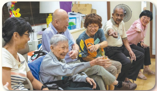
婚礼和婚姻的回忆环节: 参加者向“新婚”的新郎新娘敬酒。

与我们合作: 如果您想了解更多了解如何与我们合作去关爱社区里的长者, 请发电子邮件至 pccp@slec.org.sg 。