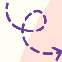
学生时代的回忆环节: 大家一起指向曾就读于美以美女子学校(苏菲雅山)的可爱长者, 她从前每日需要爬上100级台阶去上学。